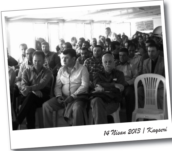
14 Nisan 2013 | Kayseri

Sınıf devrimcilerinin Ankara ve Kayseri'nin sanayi havzalarıyla emekçi semtlerinde haftalardır çalışmasını yürüttükleri ve "İşçilerin Birliği Halkların Kardeşliği" şiarıyla çağrısını yaptıkları Sınıfa Karşı Sınıf Kurultayı 14 Nisan'da gerçekleştirildi.