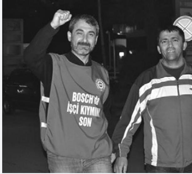
İşçi sınıfının uluslararası birlik, mücadele ve dayanışma günü 1 Mayıs ile ilgili olarak işçiler görüşlerini gazetemizle paylaştılar...