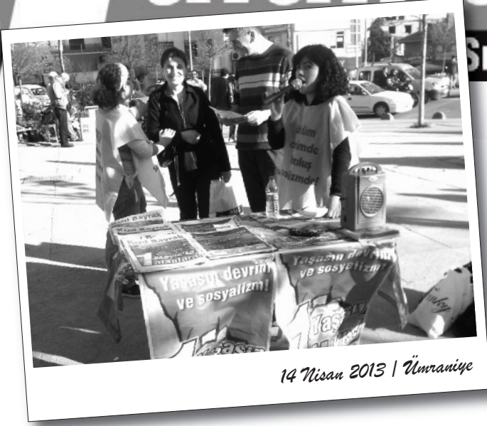
14 Nisan 2013 | Ümraniye

1 Mayıs'ı özüne uygun olarak geçirmek için sınıf devrimcileri işçi ve emekçileri "İşçilerin birliği, halkların kardeşliği" şiarı altında mücadele etmeye çağırıyor.